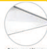
Toit en verre / Glass top