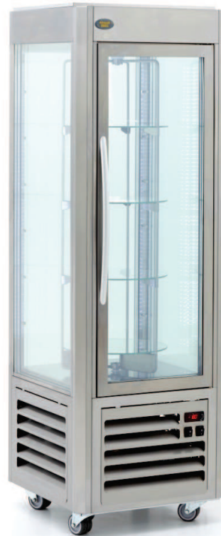
RDN 60 T