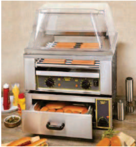
RG 11 + CB 20