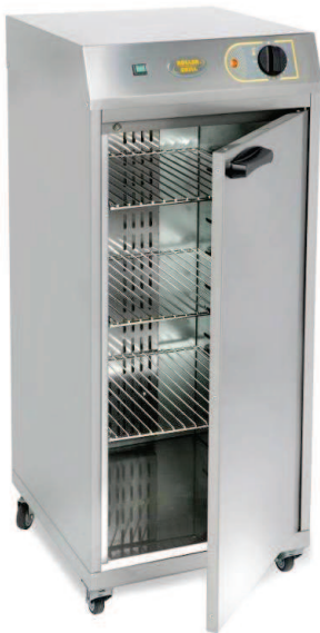
HVC 60 GN