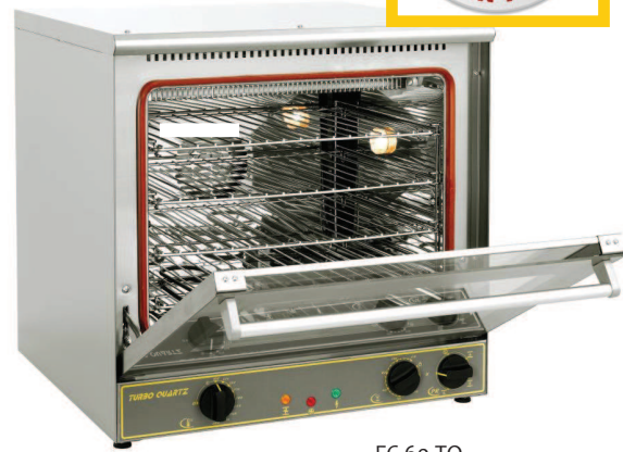
FC 60 TQ