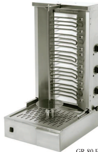
GR 80 E

De gastoestellen zijn uitgerust met 2 tot 4 infrarode branders met een veiligheidsthermokoppel, elke brander is afzonderlijk te bedienen en is voorzien van een lage werkstand. Standaard geleverd met butaan/propaansproeiers en een set sproeiers voor aardgas. Geleverd zonder opties.