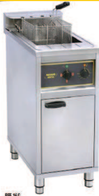
RFE 16 C