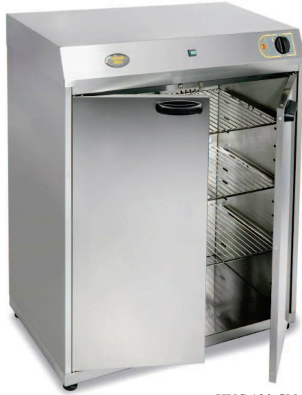
HVC 120 GN