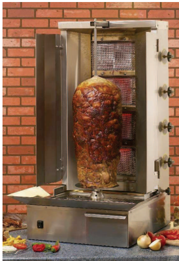
GR 80 G + BV1 + 36132VO