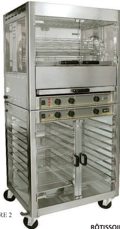
RBE 25 + RE 2