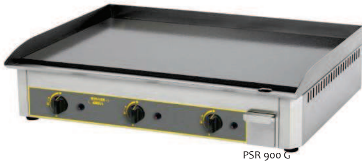
PSR 900 G