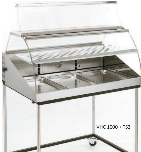
VHC 1000 + TS3