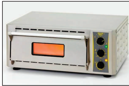
PZ 430 S