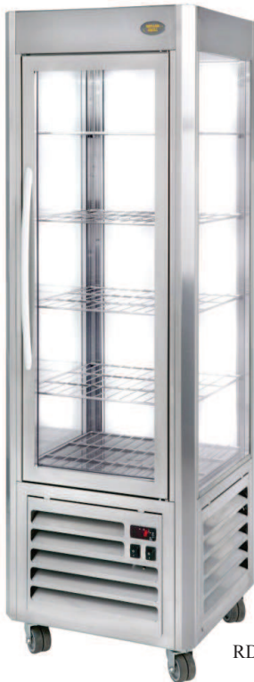
RDN 60 F