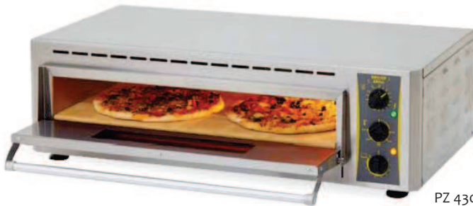
PZ 4302 D