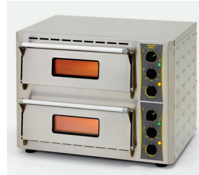
PZ 430 D