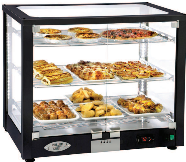
WD 780 -DN