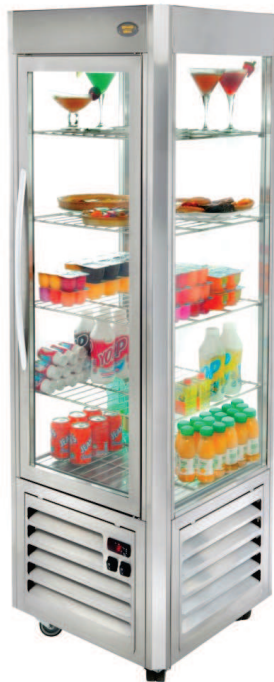
RD 60 F