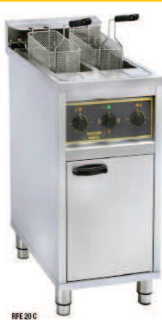
RFE 20 C