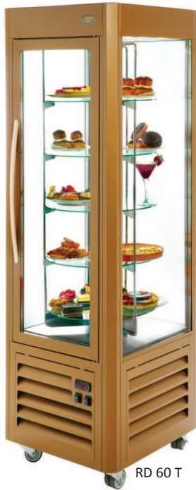
RD 60 T