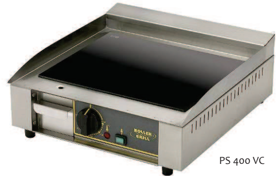
PS 400 VC