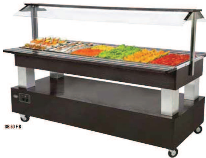
SB 60 FB