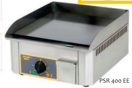
PSR 400 EE