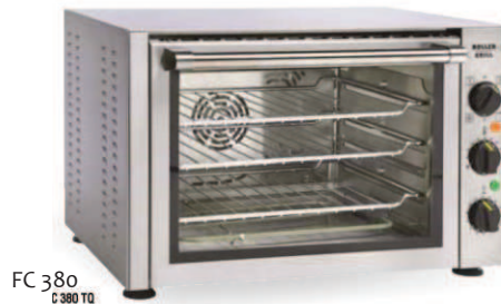
FC 380 FC 380 TQ