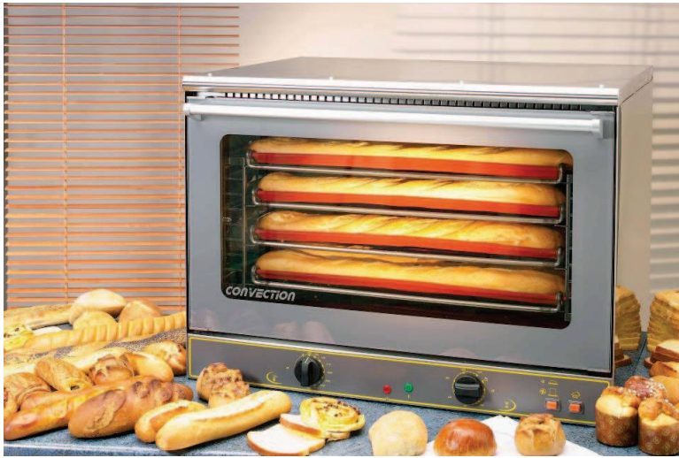
FC 110 E