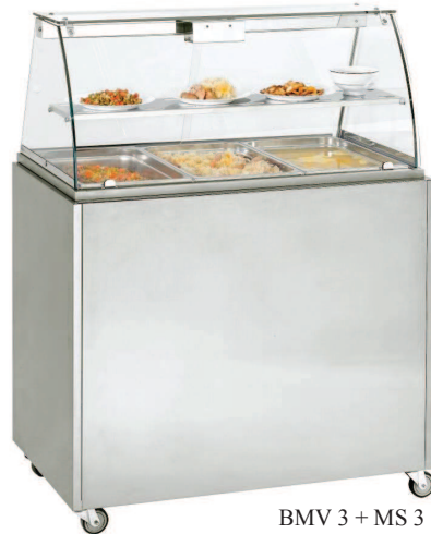
BMV 3 + MS 3