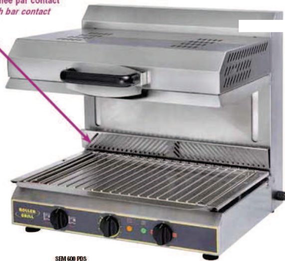
SEM 600 PDS